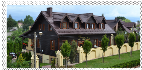
Hotel – Restauracja „Pod Katedrą”

Przypomnijmy, że Królestwo Polskie traktuje „III RP” jako okupanta Ziem Korony Królestwa Polskiego.