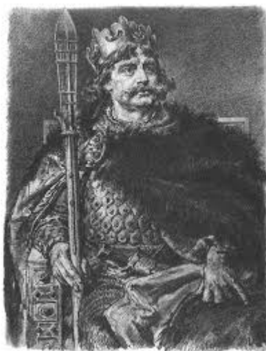
Bolesław Chrobry Król Polski

Wszehwładny rozdawco koron i tronów – Boże! Nieśmiertelny Królu Królów - Jezu Chryste! Niech będzie pochwalony Jezus Chrystus i Maryja zawsze Dziewica! Szlachetni! Lachy, Lechy, Lehici, Wenedowie, Sarmaci, Polacy! Laudetur Jesus Christus!