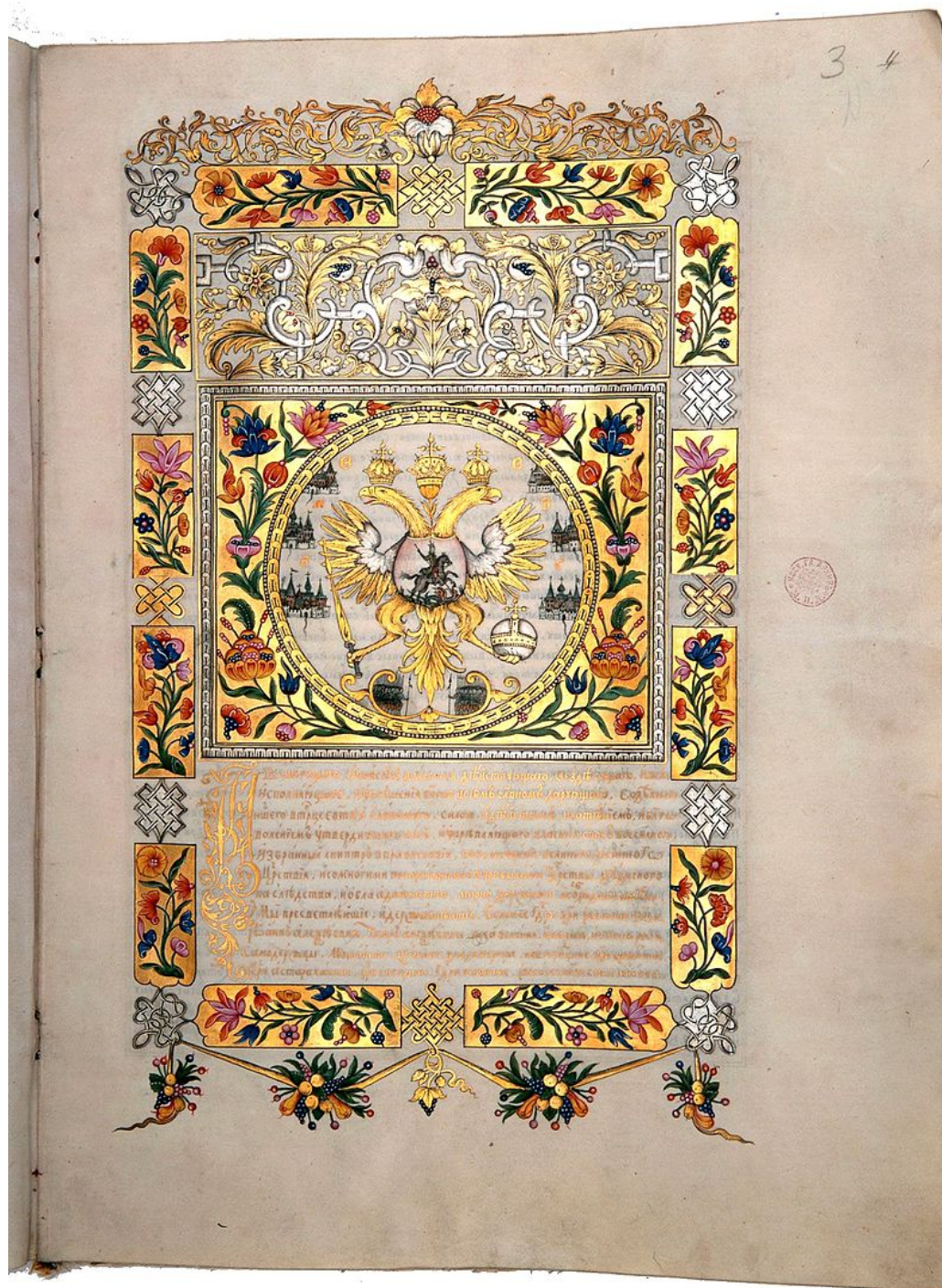
Strona Traktatu Pokojowego (Grzymałtowskiiego) z 1686 roku