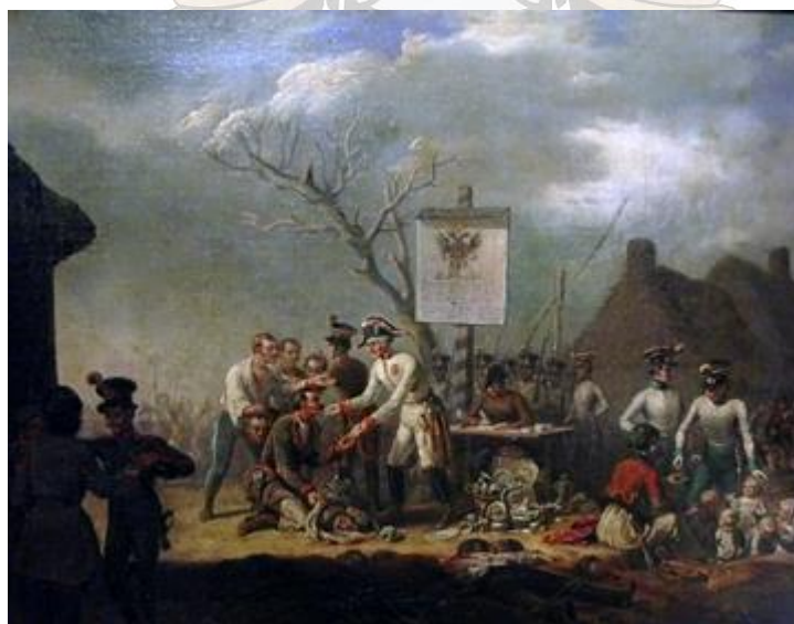
Rzeź Galicyjska 19 luty (początek) A.D.1846