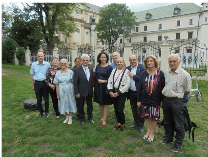
Foto — 16 lipiec A.D.2022 „Na Skałce” w Krakowie po III Kongresie Słowiańskim