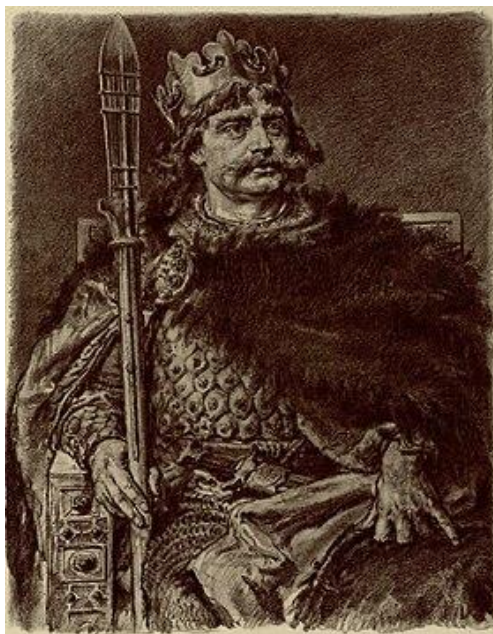
Bolesław Wielki Chrobry