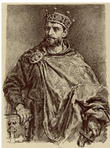
Mieszko II Lambert