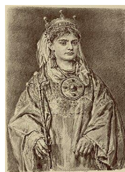
Władcy Polski koronowani w 1025 roku