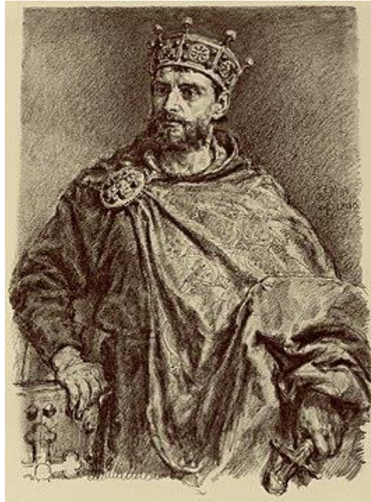
Mieszko II Lambert Koronowany Król Polski w 1025 roku