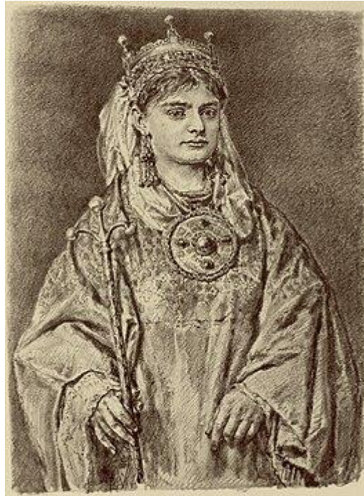
Rycheza Lotaryńska Koronowana Królowa Polski w 1025 roku